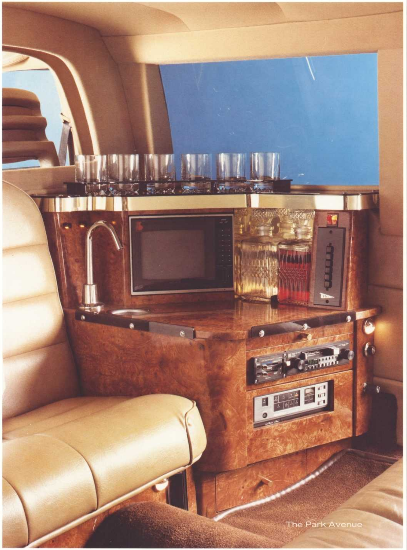
The Park Avenue